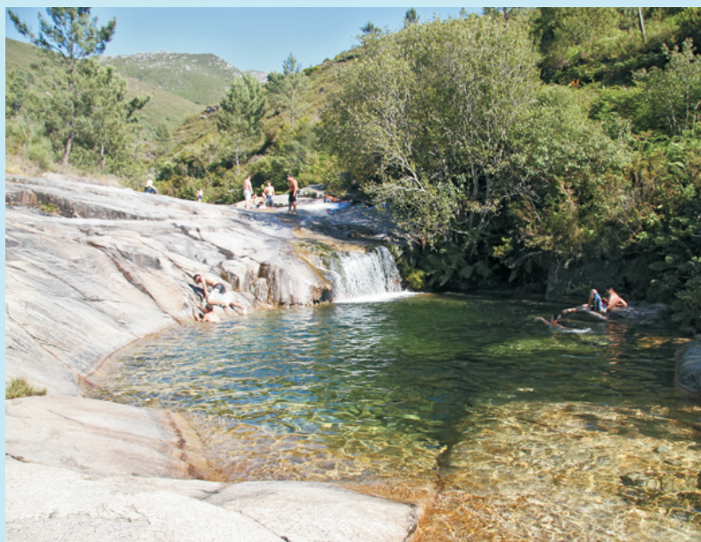
O mellor conxunto de poza, salto e laxes escorregadoiras que se atopa no percorrido.

Esta ruta combina o atractivo da natureza e a etnografía co lecer de tomar o sol e bañarse nas pozas de augas transparentes.