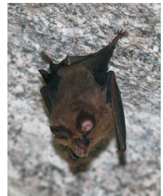
Morcego de ferradura. No interior dos muíños pódense atopar, colgando do teito, morcegos durmindo.